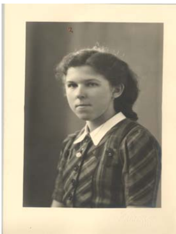
A 20 ans

Après ces périodes, je suis entrée au pensionnat des sœurs de la Providence de Jodoigne qui était une école ménagère. Nous ne rentrions chez nous qu'une fois par trimestre. En 1939 la situation internationale était grave et lors de la mobilisation je suis rentrée à la maison. j'ai alors repris le travail ménager et de la ferme. J'ai vécu les 5 années de guerre dans le cercle familial qui s'est agrandi par le mariage de ma sœur et la venue de deux enfants.