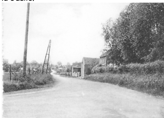
Branchon. — La Chaussée Romaine

fermes isolés, avec parfois un oppidum , centre religieux plus qu'administratif. Branchon était un relais sur la voie romaine ( Chaussée Romaine), appelée aussi erronément de Brunehaut ( nom de la Reine d'Austrasie en 534-613), reliant Aix-en-Chapelle, via Tongres ( civitas Tungrorum ) à Bavay ( civitas Nerviorum ), à la frontière française, et situé plus précisément entre Waremmes et Perwez, suivant astucieusement la ligne de crête des plateaux entre les vallées du Geer et de la Meuse! Un chapiteau provenant d'une villa romaine a été retrouvé dans la localité. Ces nombreuses voies de qualité constituaient pour l'armée romaine un plan stratégique indispensable dans les axes de communication, telle une toile d'araignée, pour conquérir toutes ces régions les plus reculées et d'assurer la maîtrise de TOUTE la Gaule.