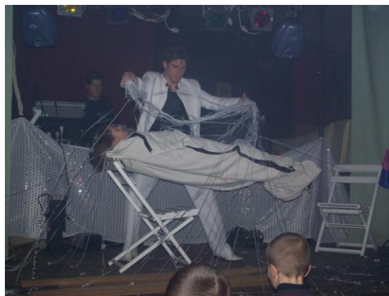
un moment de magie pendant le repas