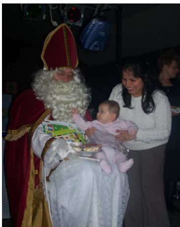
du plus petit