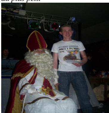
aux plus grands