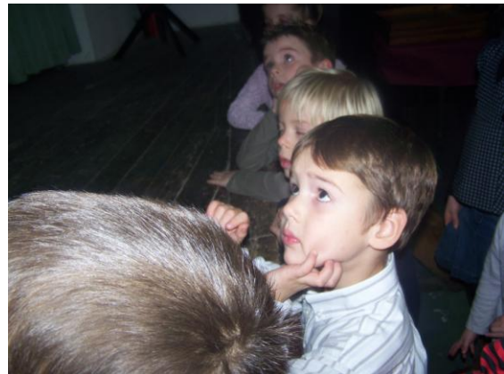
On est vraiment très attentif