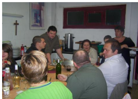
on ne s'embête pas en cuisine